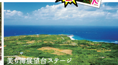
美ち海展望台ステージ