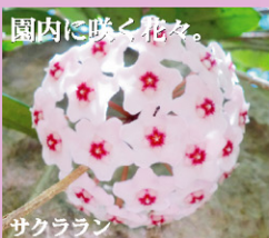
園内に咲く花々。 サクララン