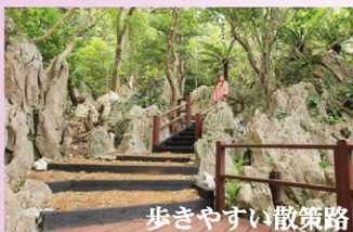
歩きやすい散策路