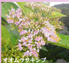
オオムラサキシブ