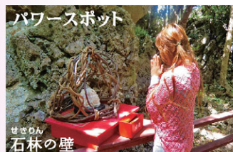
パワースポット せせりん 石林の壁